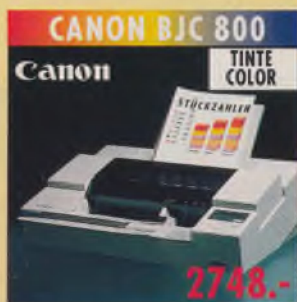
CANON BJC 800 Canon TINTe COLOR A3 und A4, 360x360 dpi, 64 Düsen je Farbe (4 Farben), 170 Z./Sek. (LQ), Einzelblattein- zug, Briefumschlagzuführung, 3 Schriften