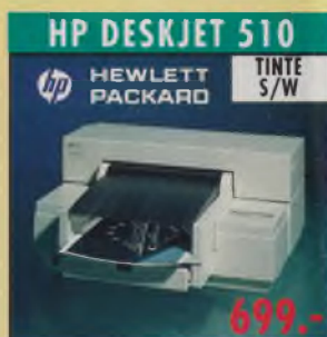
HP DESKJET 510 HEWLETT PACKARD TINTe S/W 300 dpi, 167 Z./Sek., 6 Schriften (4 skalier- bar) Einzelblatteinz., Briefumschlag- zuführung, incl. IBM Proprinter I Emulation