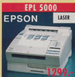
EPL 5000 EPSON LASER Laserdrucker, 512 K Speicher, 300 dpi, 6 S./Min. 2 Emulationen HP Laserjet II, EPSON-LQ