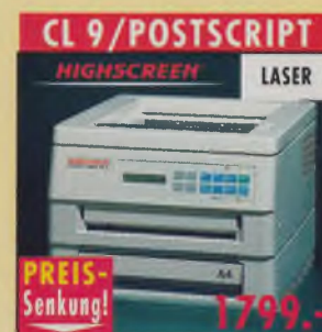
CL 9/POSTSCRIPT HIGHSCREEN LASER PostScript Laserdrucker, 300x300 dpi, 9 S./Min., 17 Original Adobe-Fonts, autom. Einzelblatteinzug. HP-Laserjet II Emulation