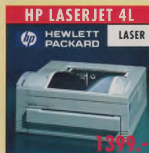
HP LASERJET 4L HEWLETT PACKARD LASER 300 dpi, Micro-Tuner, 26 skalierbr 4 S./Min., 1 MB Druckerpeicher, v omat. Einzelblatteinzug, PCL 5-Emulation