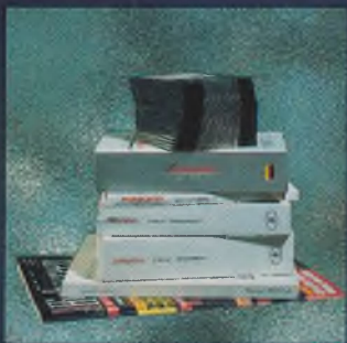
Komplett-Software mit Handbüchern und Disketten.

Der 486 DX-50 ist schneller als der 486 DX-2-50. Der INTEL iCOMP-Index beweist es.