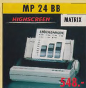
MP 24 BB HIGHSCREEN MATRIX 24-Nadel-Matrixdrucker, 360 dpi, 200 Z./Sek. (Draft), 9 Schriften, Einzel- blätter + Endlospapier, Papierparkfunktion