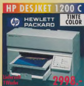
HP DESKJET 1200 C HEWLETT PACKARD TINTe COLOR 300x600 dpi (S/W-Text), 300x300 dpi (Farbe), 7 S./Min. (Text), 2 S./Min. (Farbe), 2 MB, 45 Fonts, 16 Millionen Farben