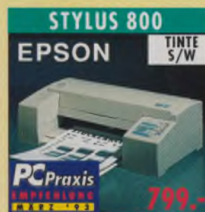
STYLUS 800 EPSON TINTe S/W A4, 360 dpi, 150 Z./Sek. (LQ), 32 KB Speicher, 7 Schriften (4 skalierbar), Einzelblatteinz., Briefumschlagzuführung