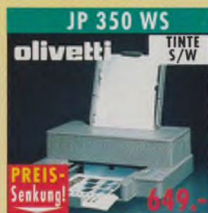
JP 350 WS olivetti TINTe S/W A4, 300 dpi, 120 Z./Sek. (LQ), 7 Schriften, 8 KB Speicher, Einzelblatteinzug, Briefumschlagzuführung