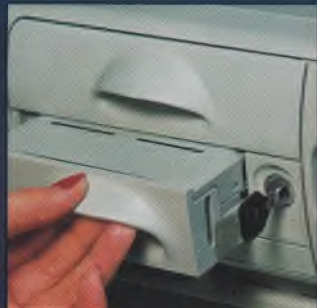
Wechselbare Festspeicherplatte: immer sofort einsetzbar.

Die WINDOWS Accelerator-Karte (1 MB) bringt alle gängigen Auflösungen auf den Bildschirm. Bei einer Auflösung von 800x600 schafft sie 64.000 Farben bei 72 Hz. Der strahlungsarme Monitor kann sich sehen lassen: Das Bild ist absolut flimmerfrei. Die Cherry-Tastatur: Made in Germany, Taste für Taste ergonomische Qualität. Zum guten Schluß neben dem einzigartigen Colani-Design noch weitere Leistungen wie z.B.: