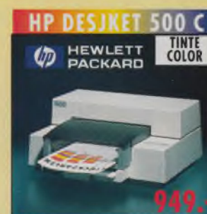
HP DESKJET 500 C HEWLETT PACKARD TINTe COLOR Farbdrucker A4, 300 dpi, 167 Z./Sek. (LQ), 3 Schriften, 48 KB Speicher, Einzelblätter, Briefumschlagzuführung