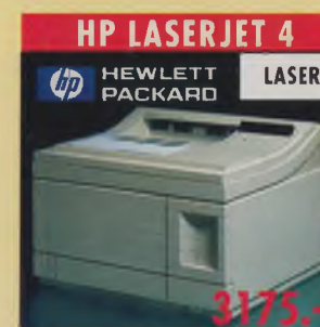
HP LASERJET 4 HEWLETT PACKARD LASER 600x600 dpi mit RET-Kantenglättung, 8 S./Min., 2 MB Druckerpeicher, RISC- Prozessor, vielfältiges Zubehör