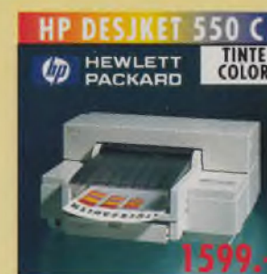
HP DESKJET 550 C HEWLETT PACKARD TINTe COLOR Farbdrucker A4, 300 dpi, 167 Z./Sek. (LQ), 3 Schriften, 80 KB Speicher, Einzelblätter, Briefumschlagzuführung